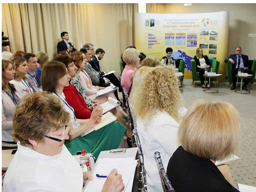
Семинар «Информационное сопровождение в проектах инициативного (партисипаторного) бюджетирования» (г. Кисловодск, 2018 г.)

По инициативе Министерства финансов Ставропольского края в 2016 году в Пятигорске состоялся первый всероссийский семинар-совещание по теме «Информационные кампании инициативного бюджетирования в субъектах Российской Федерации». Семинар открыл для российской аудитории одно из направлений деятельности в реализации программы ИБ, предполагающее планирование информационных мероприятий по вовлечению граждан в инициирование, обсуждение и выбор проектов ИБ, запустил обсуждение инструментария и методов ведения информационных кампаний местного, регионального и федерального уровней. В 2017 году в Ставропольском крае, в целях расширения охвата Проекта местных инициатив на весь регион разработали и запустили краевую информационную кампанию, опыт проведения которой был от-