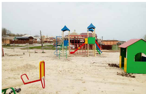
Примеры реализованных проектов в Октябрьском районе Ростовской области