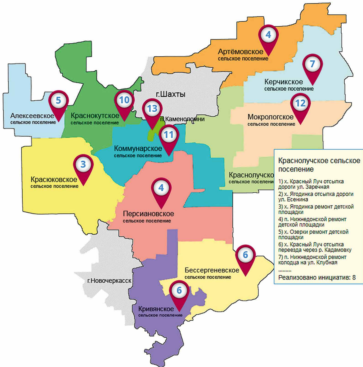
Карта инициатив Октябрьского района в 2018 году

стоимости проектов также различается – от относительно недорогих проектов ограждения детских площадок и ремонта колодцев до финансовоемких проектов по ремонту моста и приобретения водонапорной башни, газификации.