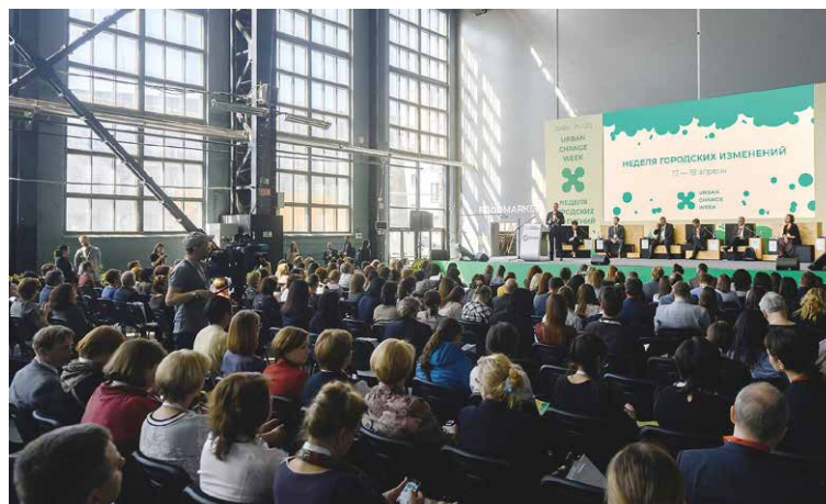
Форум общественного участия, посвященный вопросам инициативного бюджетирования, Санкт-Петербург

Обсуждение уникальности российской практики развития инициативного бюджетирования с международными экспертами из Испании, Португалии, Бразилии, США, Италии, Исландии, Южной Кореи и Китая продолжилось в рамках состоявшегося при поддержке Минфина России и Всемирного банка 18–19 апреля 2019 года в Санкт-Петербурге международного форума «Общественное участие в развитии мегаполисов: расширение возможностей» (Public Participatory Forum). Отличительной особенностью российской практики является поддержка и координация на федеральном уровне совместных усилий экспертного сообщества, органов государственной власти и местного самоуправления, граждан и представителей бизнеса в содействии внедрению инициативного бюджетирования.