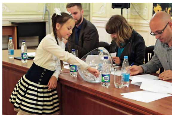
Жеребьевка членов бюджетной комиссии

Ход обсуждения и отбора проектов бюджетными комиссиями, а также их последующей реализации также освещается городскими СМИ. Таким образом, в Санкт-Петербурге выстроена системная информационная кампания практики инициативного бюджетирования «Твой бюджет».