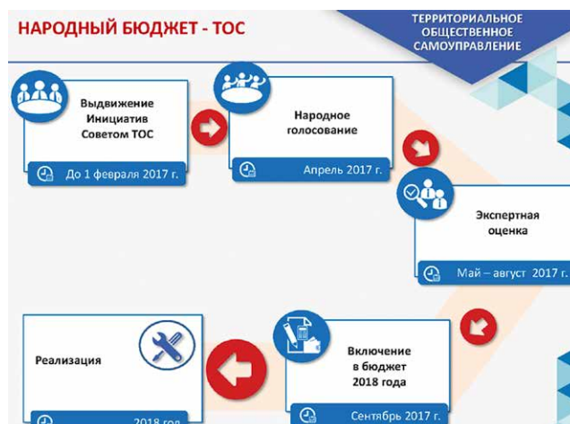
Схема реализации проекта «Народный бюджет-ТОС» в городе Череповце

В 2014–2015 годах окончательное решение принимала рабочая группа, оценивая проекты по заранее определенным критериям. С 2016 года решение о выборе проектов принимается в ходе «народного голосования», а рабочая группа их утверждает. Выбранные предложения включаются в муниципальные программы и получают финансирование из городского бюджета.