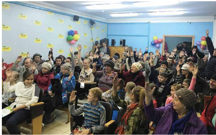
Сход жителей Рощинского сельского поселения

тий проекта «Формирование комфортной городской среды». Одновременно в области был реализован приоритетный региональный проект поддержки местных инициатив (ППМИ).