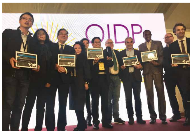
Представители Республики Саха (Якутия) на церемонии награждения конкурса «International Observatory on Participatory Democracy» (IOPD)

Обсуждение уникальности российской практики развития инициативного бюджетирования с международными экспертами из Испании, Португалии, Бразилии, США, Италии, Исландии, Южной Кореи и Китая продолжилось в рамках состоявшегося при поддержке Минфина России и Всемирного банка 18–19 апреля 2019 года в Санкт-Петербурге международного форума «Общественное участие в развитии мегаполисов: расширение возможностей» (Public Participatory Forum). Отличительной особенностью российской практики является поддержка и координация на федеральном уровне совместных усилий экспертного сообщества, органов государственной власти и местного самоуправления, граждан и представителей бизнеса в содействии внедрению инициативного бюджетирования.