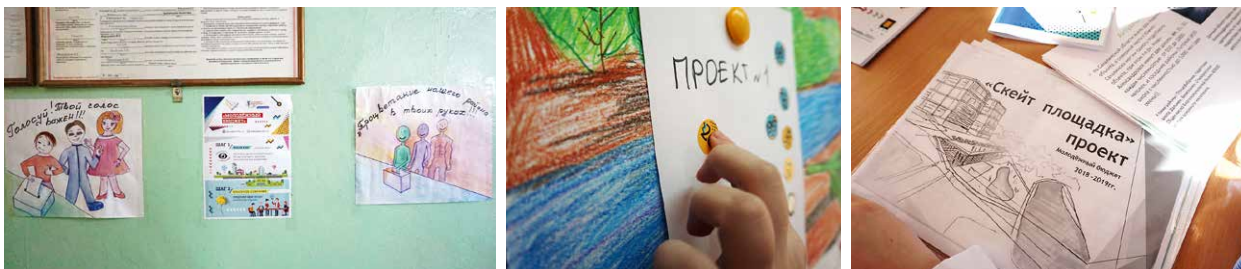
Пример школьного ИБ в Сахалинской области

с участием одноклассников проектам, ответственности за происходящее в школе, обучение азам проектного подхода и бюджетной грамотности. Активно внедряются школьные проекты инициативного бюджетирования в Сахалинской области, Республике Коми, Санкт-Петербурге, ЯНАО, Алтайском крае, Московской области (город Балашиха).