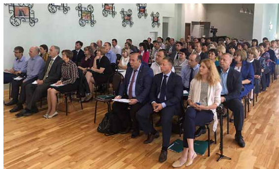
Участники информационно-обучающих мероприятий практикам инициативного бюджетирования

В 2018 году Минфином России проведены разработка и обсуждение, в том числе в Совете Федерации и Государственной Думе с участием представителей финансовых органов субъектов Российской Федерации, законопроектов о внесении изменений в Федеральный закон от 6 октября 2003 года № 131-ФЗ «Об общих принципах организации местного самоуправления в Российской Федерации» и в Бюджетный кодекс Российской Федерации в связи с определением правовых основ инициативного бюджетирования. Внесение указанных законопроектов в Правительство Российской Федерации произошло в 2019 году.