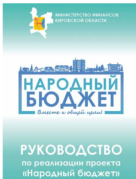
Руководство по реализации проекта «Народный бюджет»

Для участников проекта подготовлено Руководство по реализации проекта «Народный бюджет». В руководстве подробно указаны все этапы действий администрации муниципального образования, модератора и членов бюджетной комиссии. Также для городских поселений подготовлено типовое Положение о проекте.