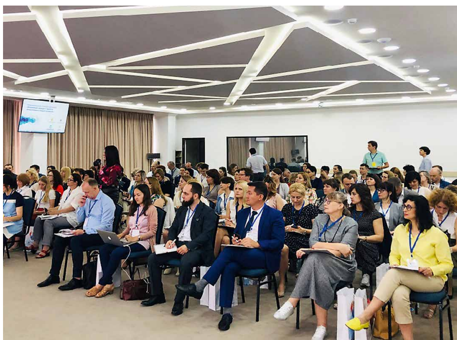
IV международный семинар-совещание «Вовлечение граждан в проекты инициативного бюджетирования» (г. Железноводск, 2019 г.)

С каждым годом дискуссионная площадка Ставропольского края привлекает все большее число финансистов и практиков в вопросах инициативного бюджетирования со всей России. За четыре года аудитория семинара увеличилась в три раза, в первом семинаре участвовали 43 человека, в 2019 году – уже более 100. Количество регионов выросло почти в два раза – с 20 до 38. Всего около 300 представителей органов государственной власти, муниципалитетов, консультантов, экспертов стали участника-