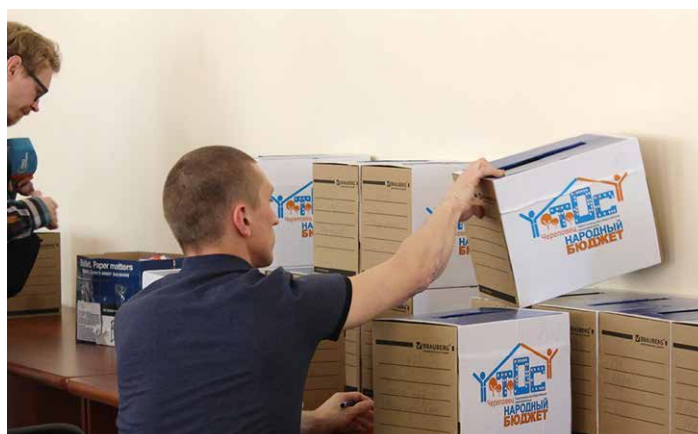
Подсчет голосов за инициативы ТОС в рамках проекта «Народный бюджет-ТОС»

За годы работы трансформировалась и концепция рабочей группы. В «Народном бюджете» в состав рабочей группы входили представители администрации, отраслевых подразделений, думы, крупнейших предприятий Череповца, а также инициаторы отобранных проектов. В рабочей группе «Народного бюджета-ТОС» представители бизнеса отсутствуют, а интересы горожан выражают представители органов ТОС (по согласованию).