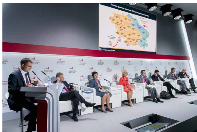
Конференция «Участие граждан как ресурс развития: российский и международный опыт инициативного бюджетирования»

Проводимая по данному направлению работа получила высокую оценку международных экспертов на конференции «Участие граждан как ресурс развития: российский и международный опыт инициативного бюджетирования» в рамках Московского финансового форума 7 сентября 2018 года.