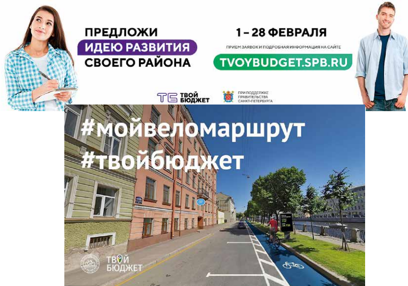
Рекламные и информационные материалы

группах практики «Твой Бюджет» в социальных сетях Вконтакте и Facebook, на канале в Youtube. За счет этого существенно увеличивается их аудитория, и другие жители города также получают возможность узнать, как и почему принимаются те или иные решения, получают базовые знания по бюджетному процессу, финансам, урбанистике и государственным закупкам.