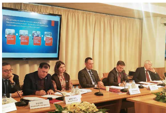
Обсуждение правовых основ инициативного бюджетирования

Проводимая по данному направлению работа получила высокую оценку международных экспертов на конференции «Участие граждан как ресурс развития: российский и международный опыт инициативного бюджетирования» в рамках Московского финансового форума 7 сентября 2018 года.